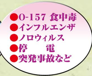
施設で考えられる色々なリスクに対応!!