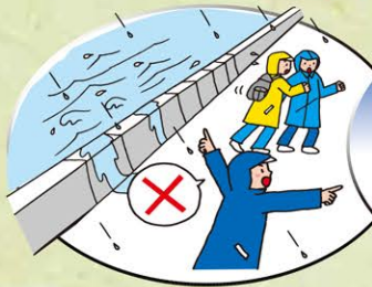
大雨で河川が警戒水位を超えた!!