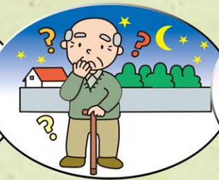
お年寄りが突然施設からいなくなった!!